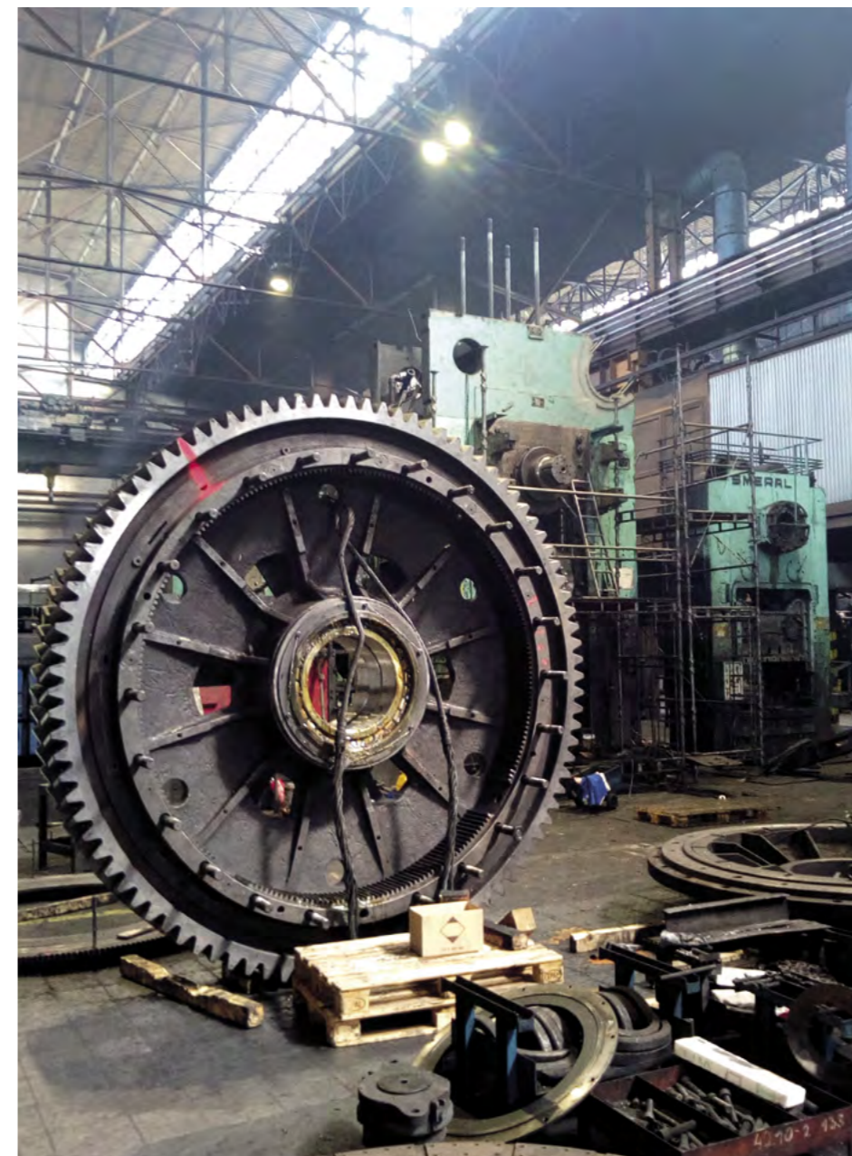
Oprava lisu LZK 4000/1 v kováčni HKS Forge

Partia oprávárov z Česka plnila počas júna v kováčni HKS Forge dôležitú misiu. Na kovacom lise LZK 4000/1 robili strednú opravu, ktorej najdôležitejšou časťou bola inštalácia opraveného barana.