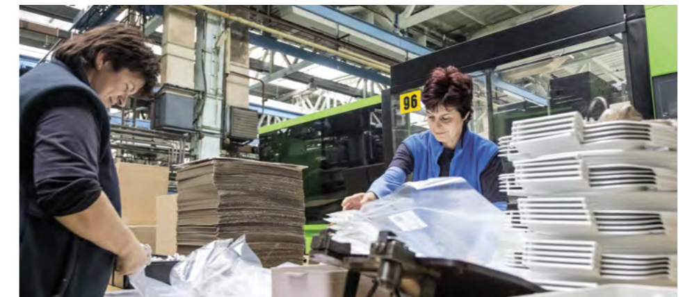
Výroba antibakteriálnych wc sedadiel s prísadou striebra

Po koronakríze všeobecne stúpa dopyt po hygiene, na čo reagujú hlavne koncoví zákazníci. Na tento trend, ktorý bude určite pokračovať aj v budúcnosti, musíme pružne reagovať a vo vlastnej réžii vyvíjať moderné produkty, ktoré splnia budúce požiadavky trhu. Momentálne zavádzame do výroby celú sériu hygienických antibakteriálnych výrobkov s prísadami, ako je napr. striebro. V rámci spoločenskej zodpovednosti a dlhodobej spolupráce s mestom Myjava sme samospráve venovali dar v podobe 320 nových antibakteriálnych WC sedadiel so zložkami striebra a 60 nových vodovodných batérií, určených pre školské a predškolské zariadenia, športový areál, kultúrny dom, verejné WC a ďalšie budovy. Verím, že aj takto sme prispeli k zvýšeniu ich hygienického štandardu a lepšej prevencii obyvateľov mesta Myjava.